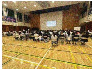
港南アカデミー 6月22日(月)