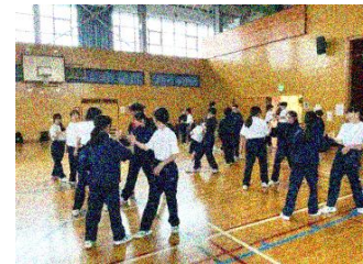
移動教室(1年) 6月26日(金)~28日(日)