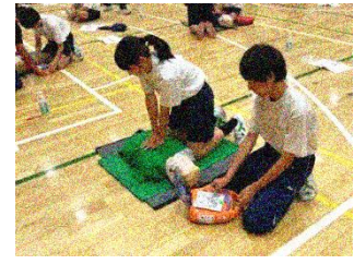
普通救命講習(1年) 6月4日(木)・5日(金)