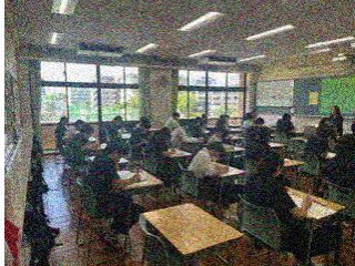
期末考査 6月17日(水)~19日(金)