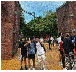
修学旅行(3年) 6月1日(月)~5日(金)