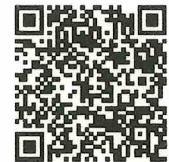
Minato City website

For those wishing to apply by post or in person, you can download the template of the application form from the Minato City website, or receive a form from the School Affairs Section, School Administration Support Subsection of the Minato City Secretariat of the Board of Education.