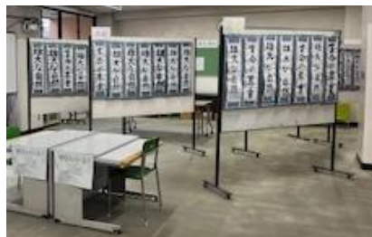
こうなんふれあいクリーン作戦