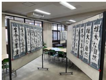
授業の様子(複線型授業)