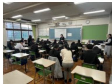
国際交流(なぎなた部)