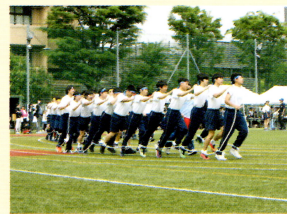
運動会むかで競争

運動会では全校生徒による応援団、港南ソーラン、クラスや学年をこえた団結力を高めます。 学芸発表会では合唱コンクールをはじめ英語スピーチや弁論発表、海外派遣発表など言語活動を充実し、思考力・表現力等高めます。