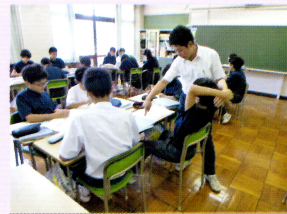
アカデミー研究授業

港南アカデミーは港南中学校、港南小学校、芝浦小学校、港南幼稚園、芝浦幼稚園の2園3校で構成されています。幼児期の教育（3年間）から、小中学校の義務教育（9年間）を連続したものと捉え、カリキュラム連携、アカデミー内の幼児・児童・生徒の行事を通じた交流、教員の保育・授業研究などを実施し、12年間を見通した指導方針のもとで子供たちを育てる幼・小中一貫教育に取り組んでいます。