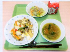
旬の食材を活かして

安全で安心な給食であることはもとより、生徒が苦手としがちな食材もおいしく食べられるよう献立を工夫しています。生涯を通じて健康に過ごせる体作りや食習慣が育まれるよう、給食指導や委員会活動など様々な取り組みを予定しています。