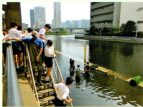
フィールド・リサーチ