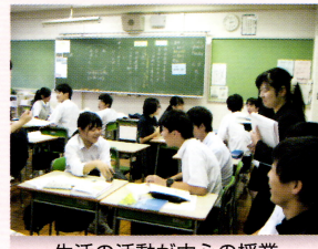
生活の活動が中心の授業