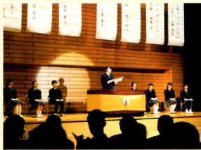
学芸発表会での弁論発表