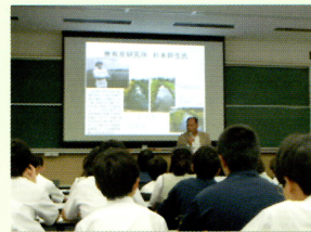
東京海洋大学で運河学習

運河学習では、大学教授や大学生に教えてもらい、フィールド・リサーチの方法やまとめ方、発表の仕方を学びます。運河の水質調査や生物調査を行い自分の住んでいる地域を知り、環境学習を深めます。