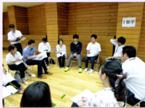
アカデミー研究協議